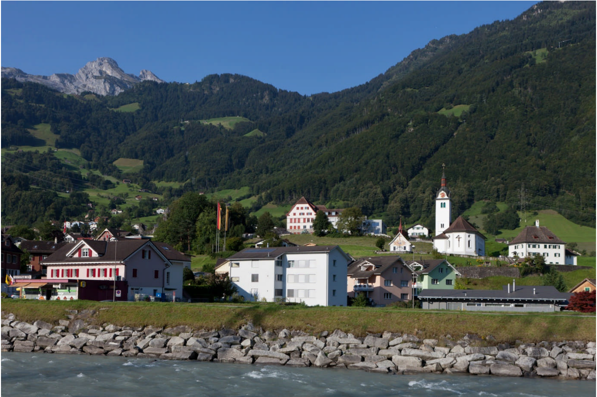
Attinghausen (UR): Oben Original – unten Fälschung mit 10 Abweichungen