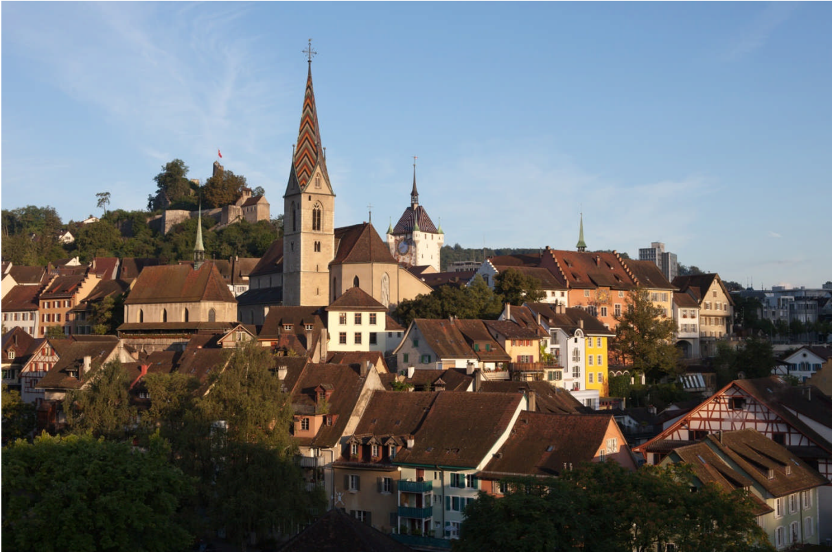
Baden (AG): Oben Original – unten Fälschung mit 10 Abweichungen